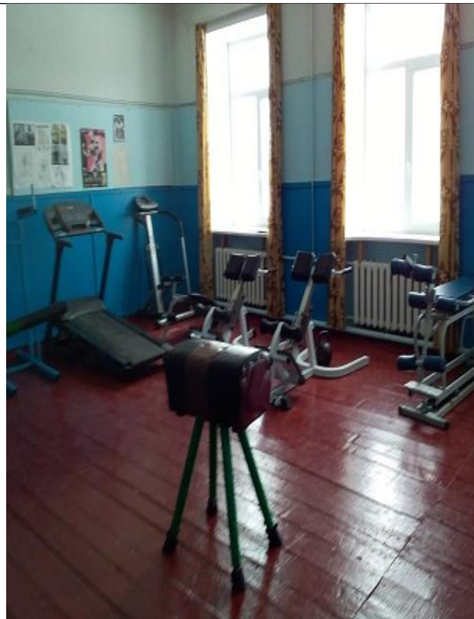
Зал тяжелой атлетики Фото №10