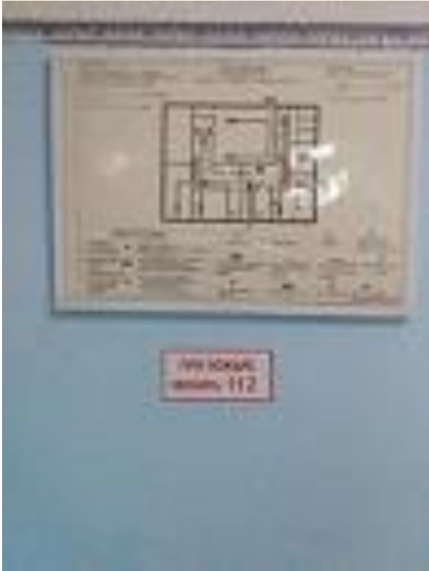
План эвакуации (1 этаж)