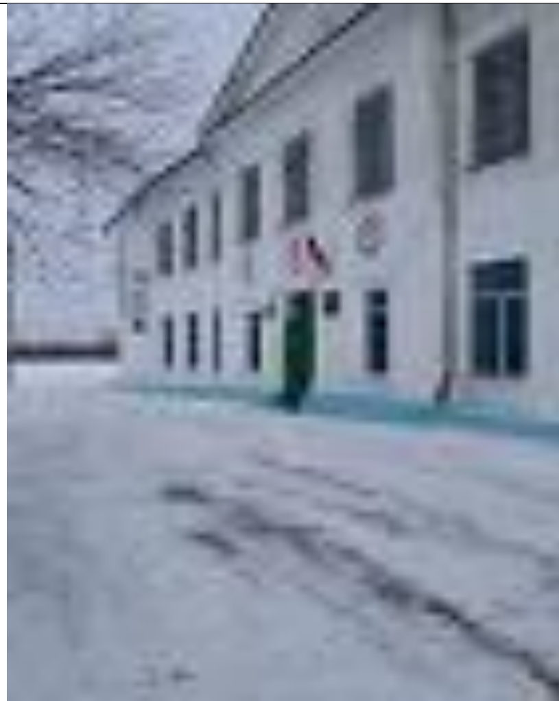
Территория, прилегающая к зданию Фото №2