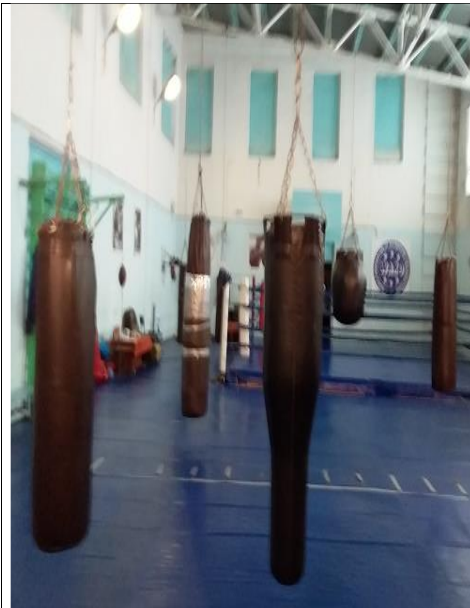
Зона целевого назначения спортивный зал Фото №9