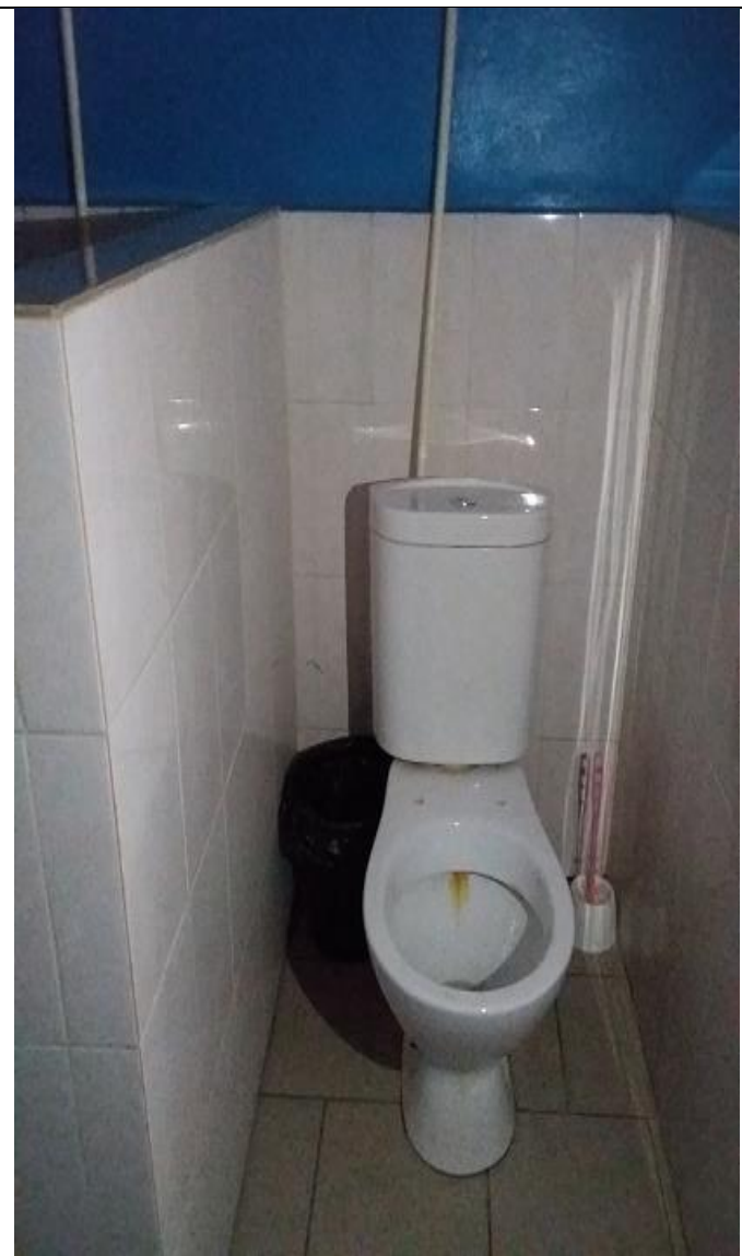
Туалет для учащихся