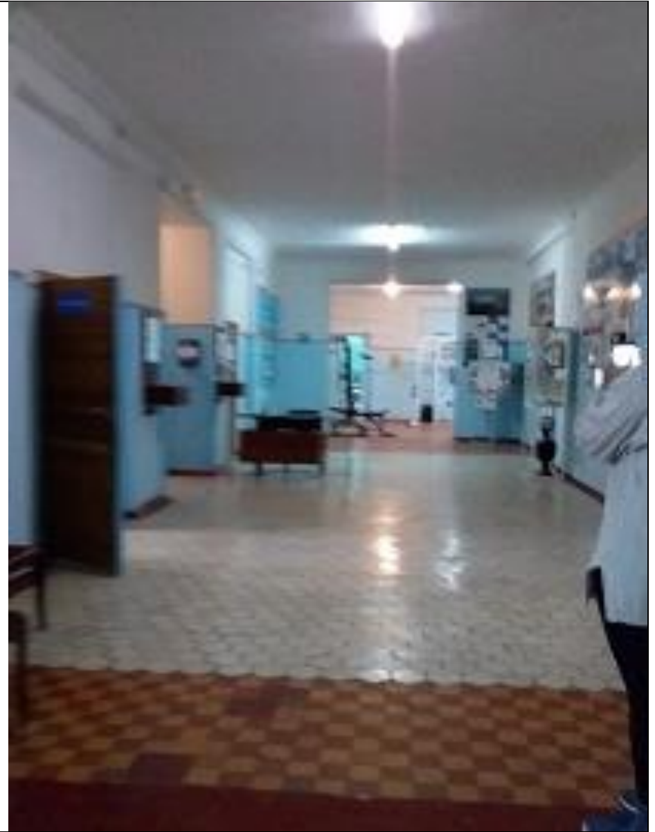
Пути движения внутри здания Фото №8