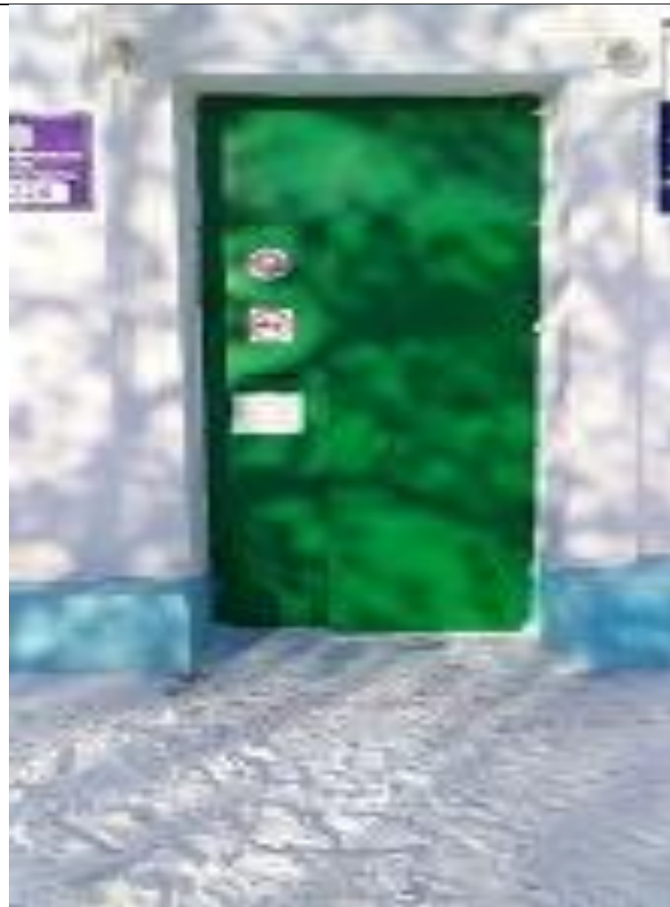
Дверь главного входа Фото №1