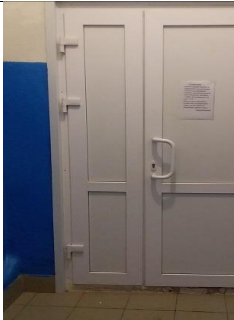
Тамбур2 Фото №4