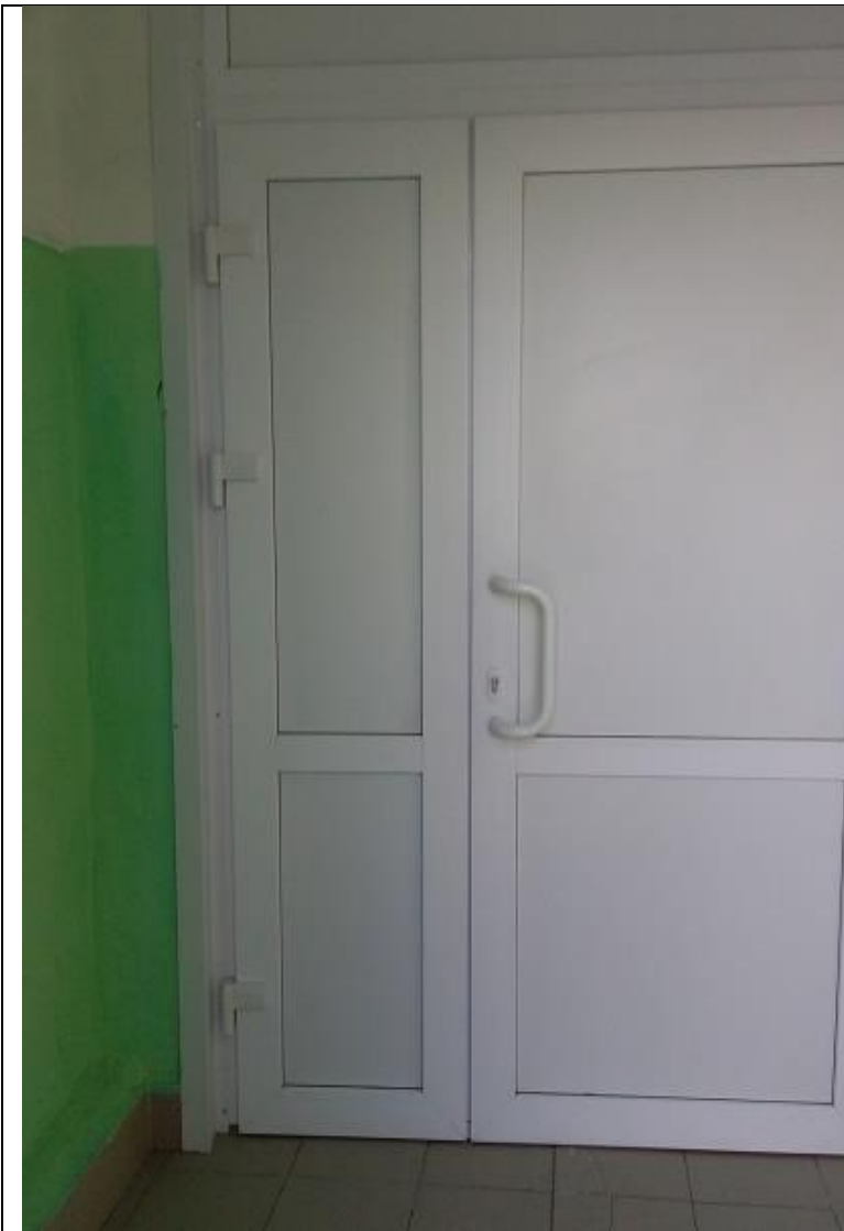
Тамбур1 Фото №3