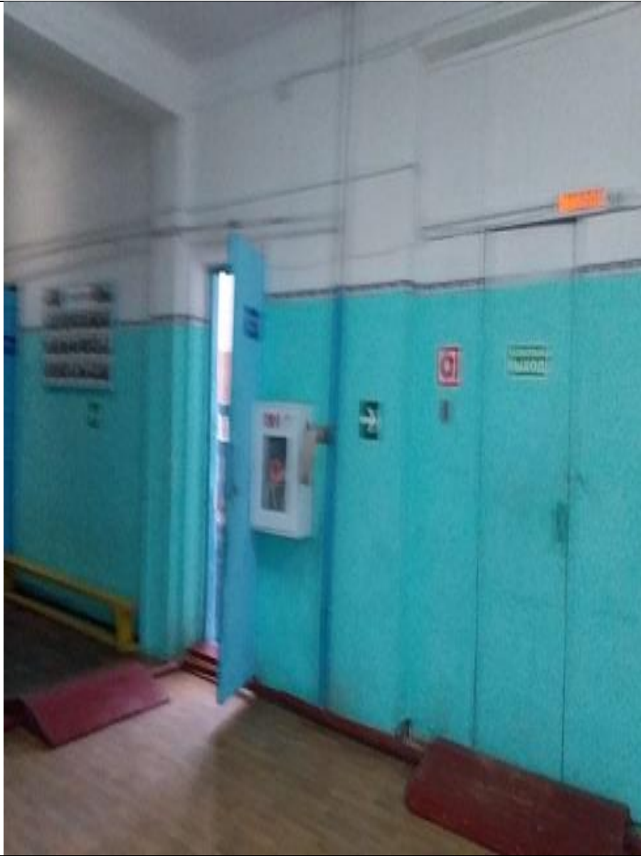
Пути движения внутри здания Фото №7