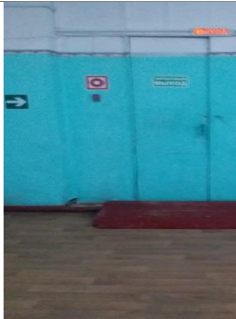
Запасной выход Фото №6