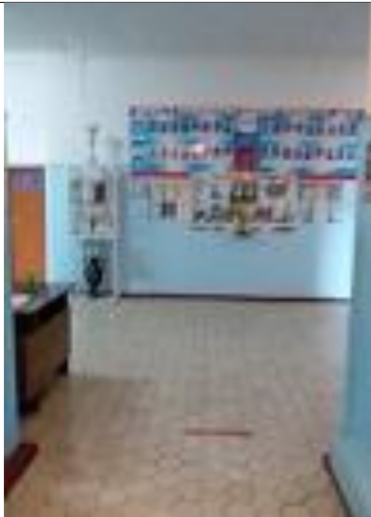
Вход в фойе (вестибюль) Фото №5