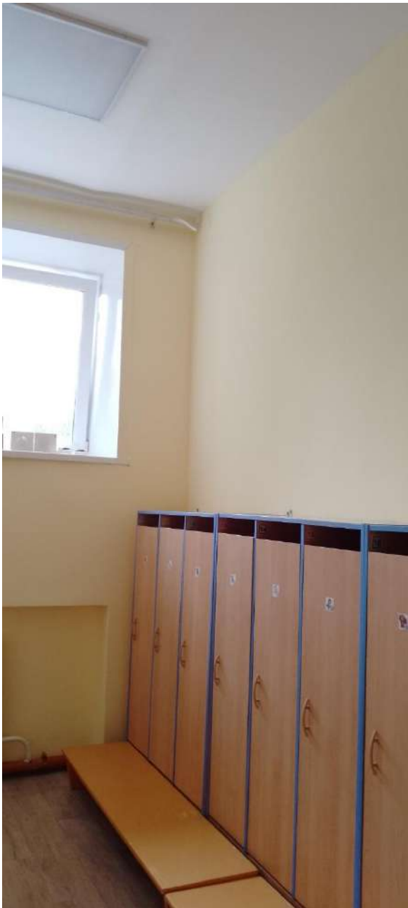
Группа №9 д/с №28 «Ёлочка»