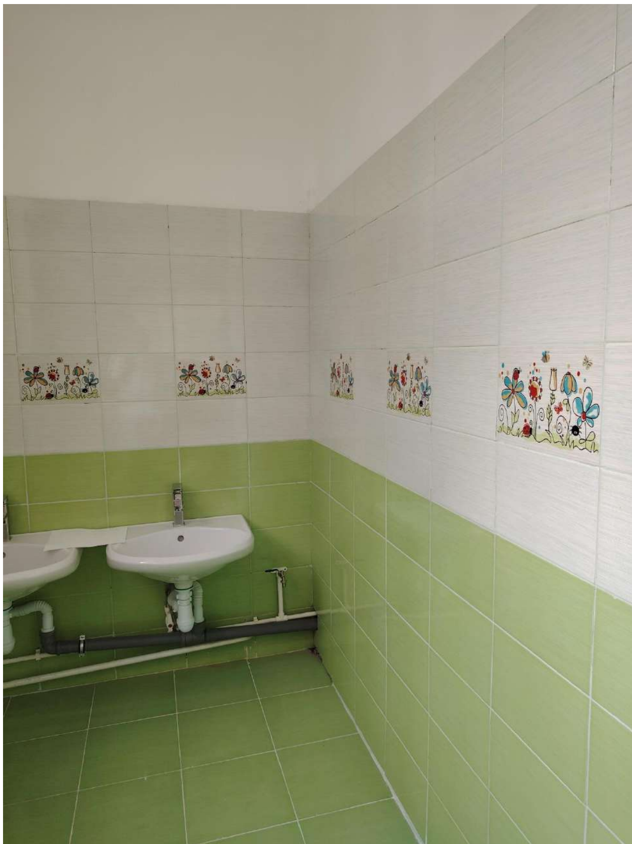
Группа № 7 - работы выполнены

Группа № 10 – материал завезен, проводятся демонтажные работы