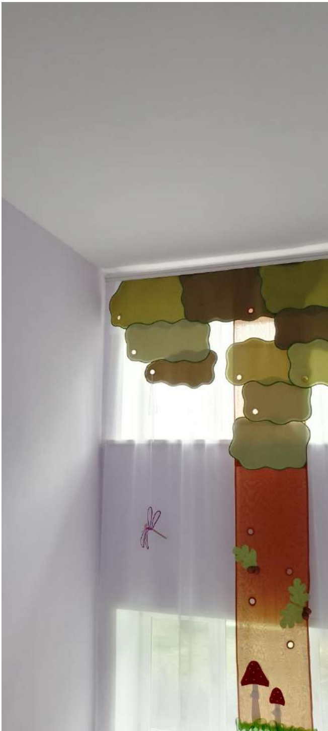
Лестничный пролет (детский сад №28 «Ёлочка»)