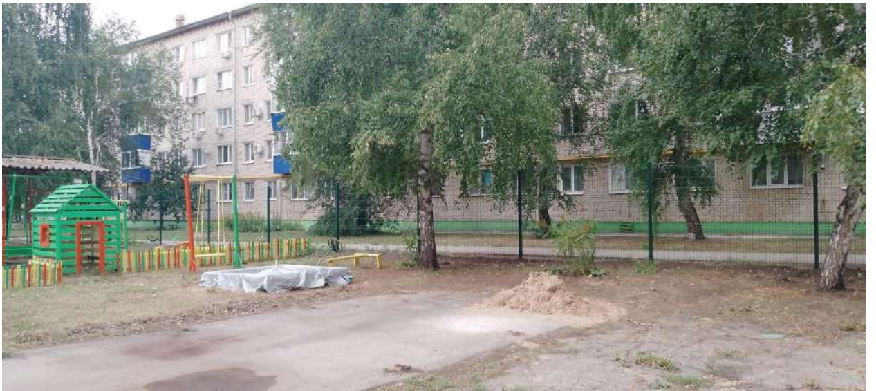
Ограждение (детский сад №28 «Ёлочка»)