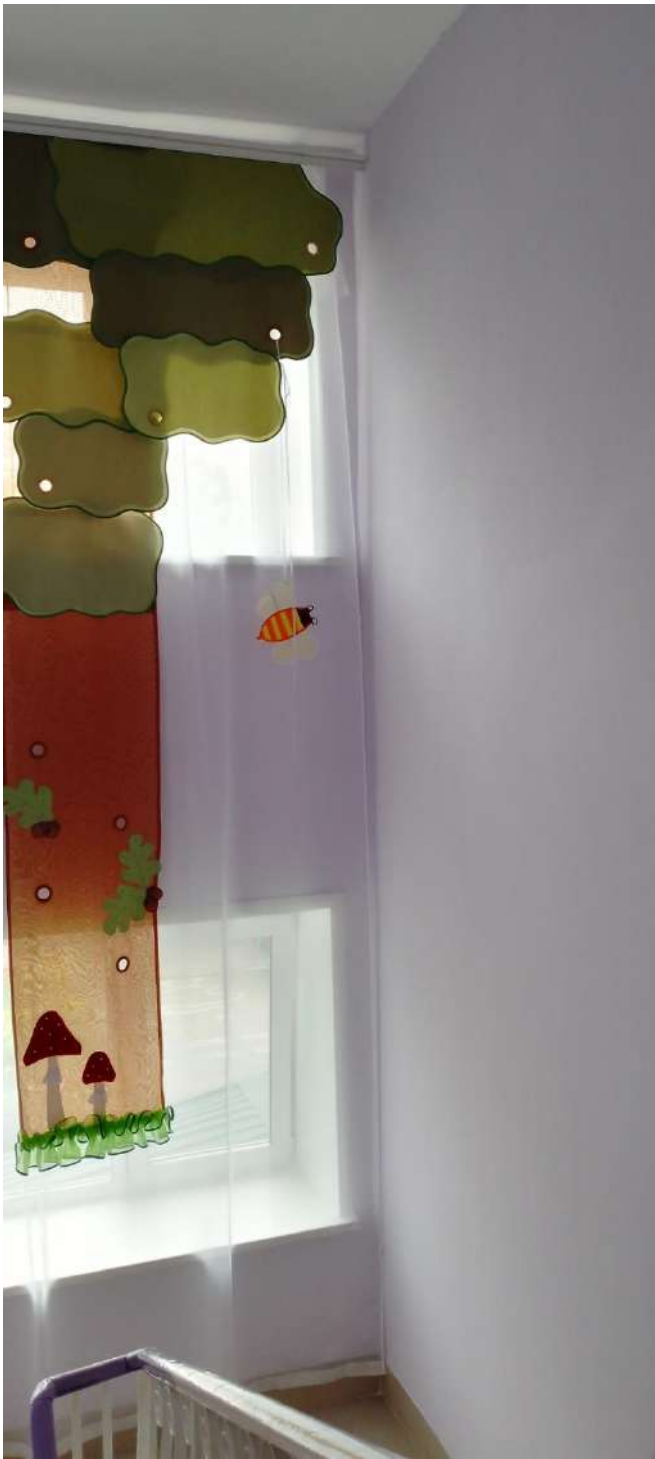
Лестничнй пролет (детский сад №28 «Ёлочка»)