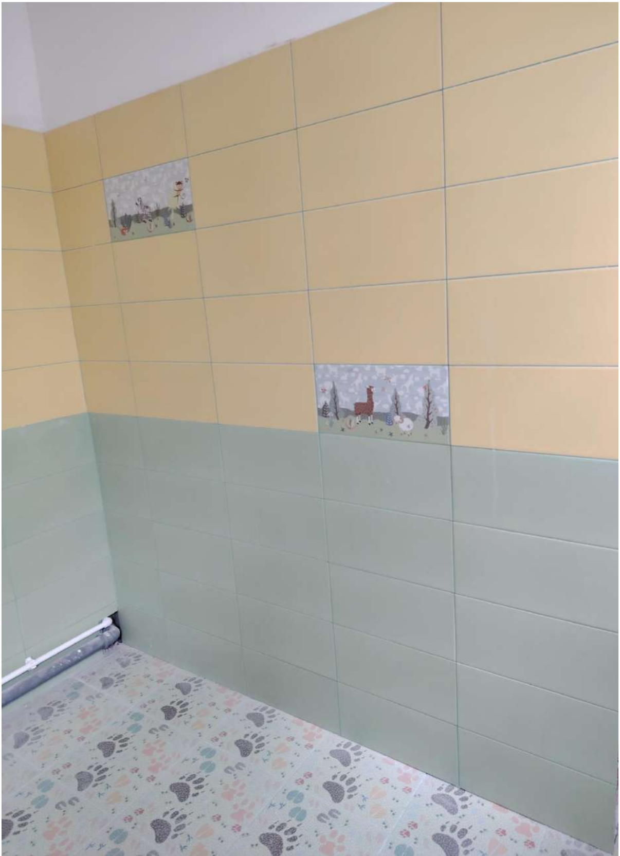
Группа № 12 Работы выполнены